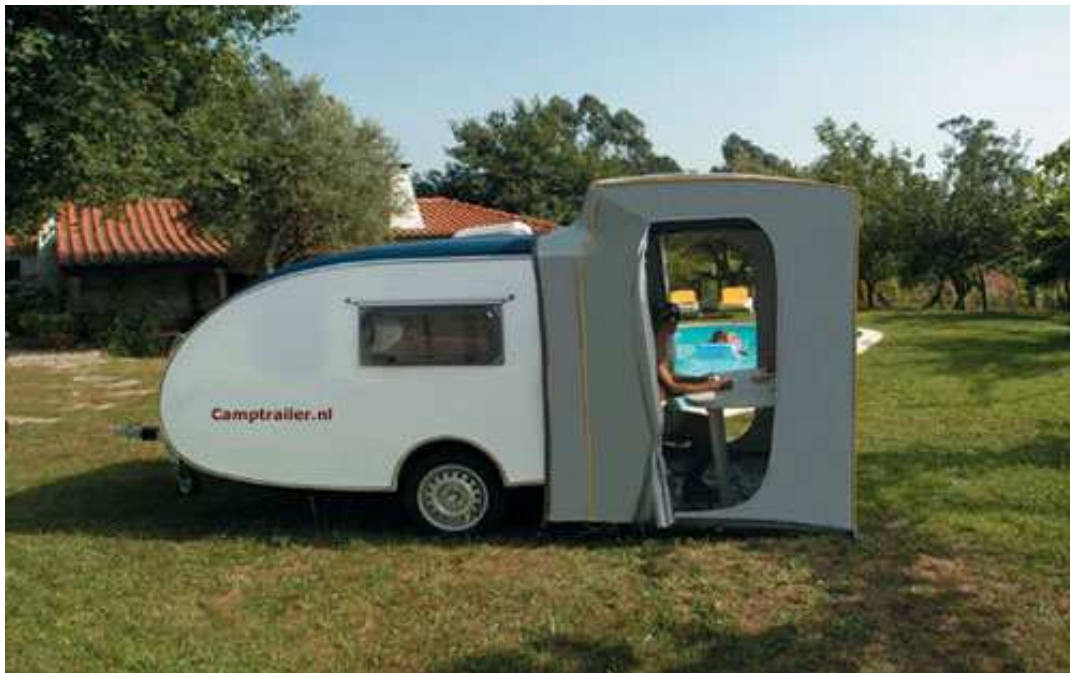
De Camptailer met tent Cabin (standaard)

De Camptailer is gemaakt voor mensen die er graag regelmatig op uit trekken, zonder teveel poespas en ingewikkelde voorbereidingen. De Camptailer staat altijd klaar voor vertrek, als je wilt zelfs in de garage want daar past hij dankzij zijn compacte vorm met gemak in (hoogte ca. 195 cm, breedte ca. 160 cm, lengte ca. 310 c.) !