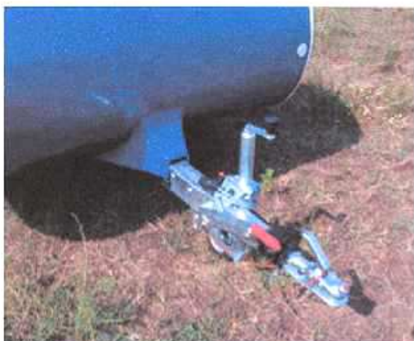
Al ko koppeling met oplooprem