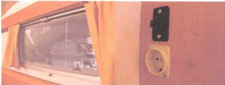
Links: vensters met rollo's met muskietengaas (optie) Rechts: 220V + 12V aansluiting