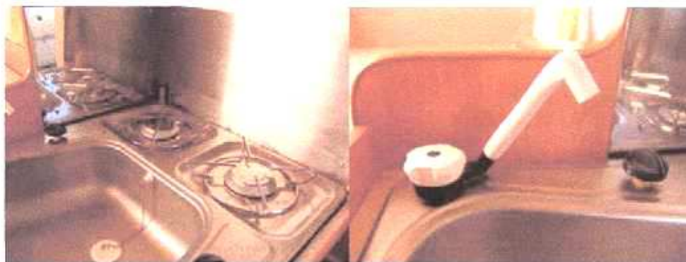
2-pits gascomfoor met wasbakje en kraantje

De kampeerder die er met de Camptailer op uit trekt, heeft een prachtige keuken aan boord. Met een 2-pits gascomfoor en een wasbakje met kraan. De watertank en de plek voor de gasfles zijn netjes achter een deurtje weggewerkt. Optioneel kan er een Dometic koelkast worden aangeschaft, die zowel op 12/220 Volt als op gas functioneert. De koelkast is uitneembaar, zodat op de camping aangekomen, deze geen leefruimte in beslag neemt.