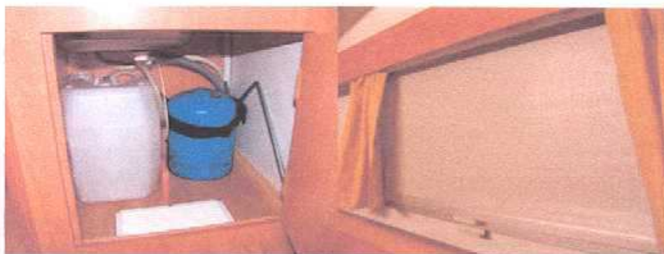
Links: plaats voor de gasfles en waterreservoir Rechts: Vensters met gordijnen en rollo's met verduisteringsfolie