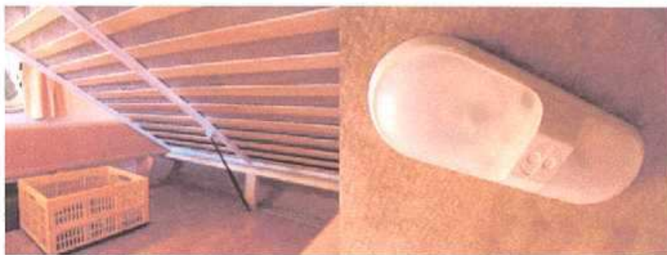
Links: Lattenbodembed met daaronder ruimte voor vouwkragen (optie) Rechts: interieur lampen aan het plafond