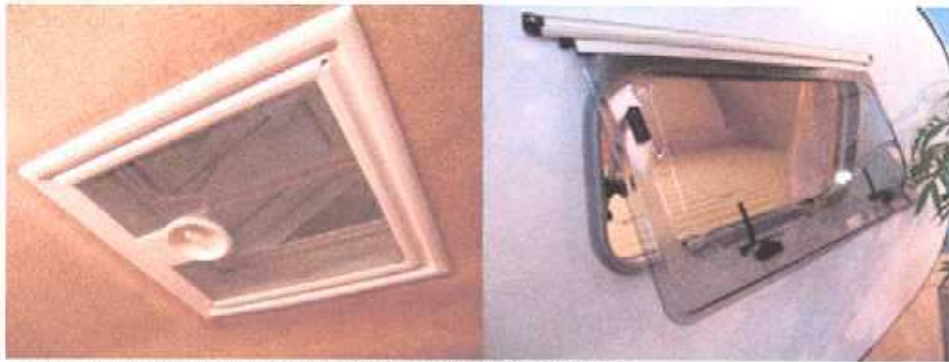
Links: Dakluik met muskietengaas Rechts: 3 te openen vensters