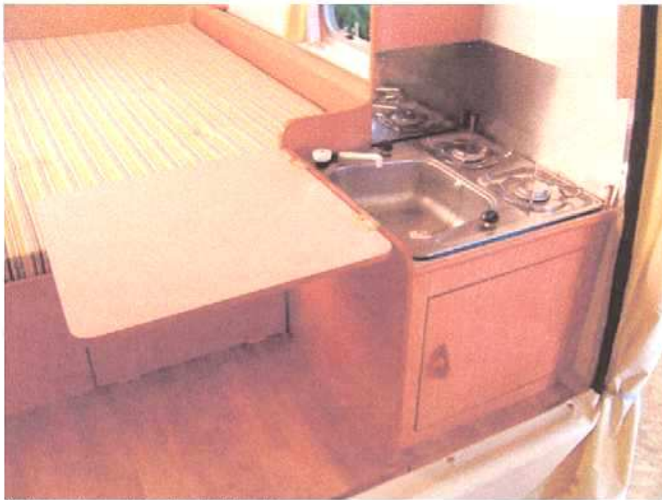
Keuken met vouwbare aflegplank (optie)