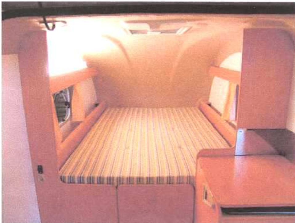
Het grote bed met bagagecompartimenten aan de zijkanten.

Slapen doe je op een ruim tweepersoons bed van ca. 195 x 135 cm. Onder het bed bevindt zich een gigantische bagageruimte. Ook aan de zijkanten van het bed kun je één en ander kwijt in de handige bagagecompartimenten.